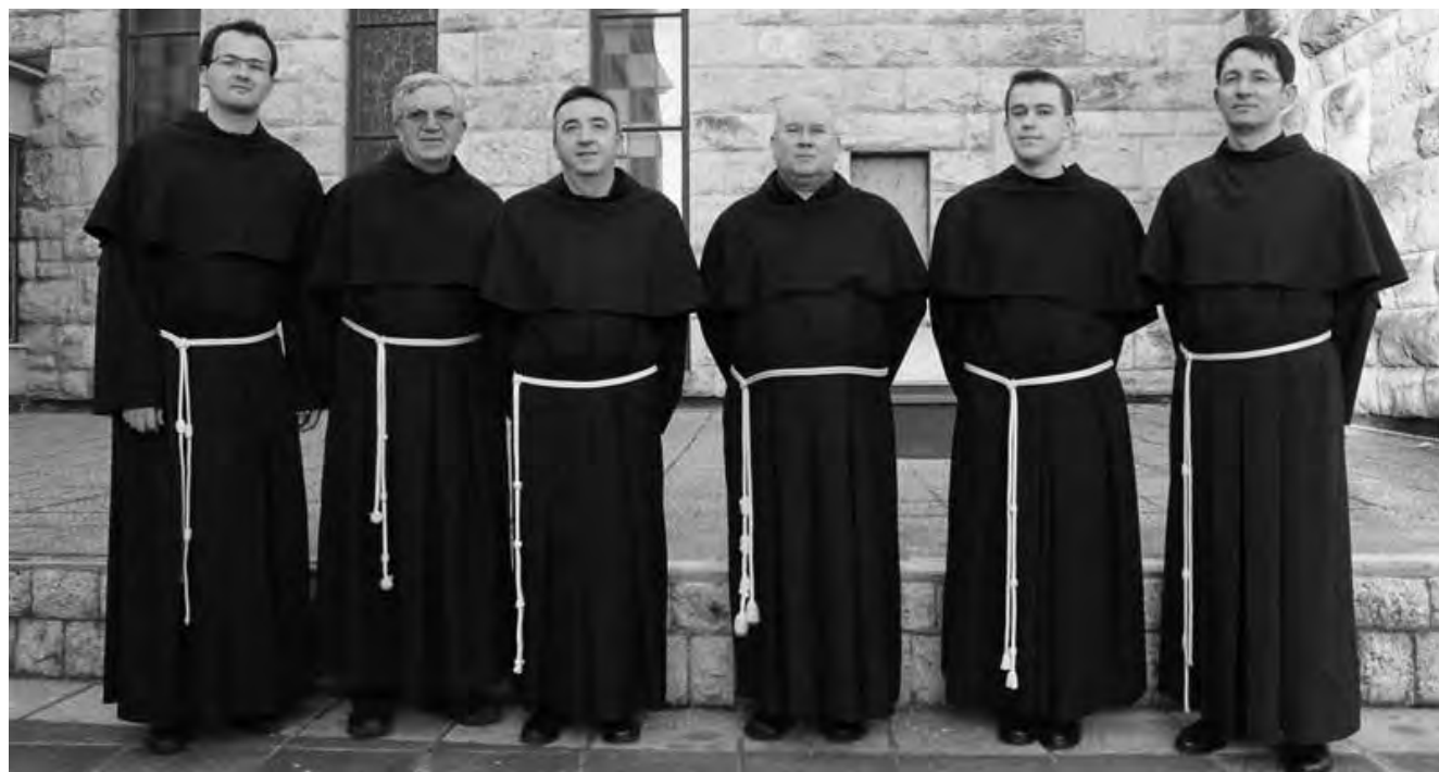
NOVA PROVINCIIJSKA UPRAVA